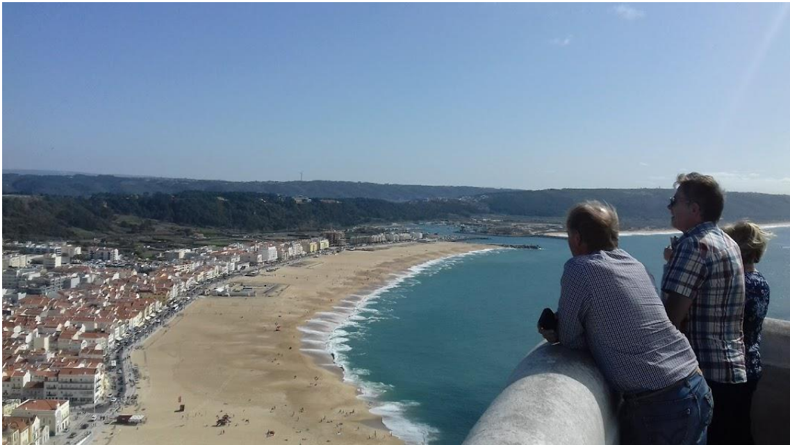
Nazaré on huikeiden näköalojen paikkakunta Keski-Portugalin Hopearannikolla.