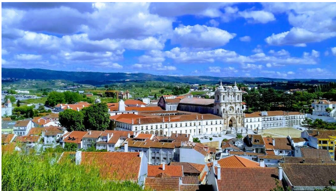
Alcobaça n kaupunkikuvaa hallitseva luostari on UNESCO:n maailmanperintökohde.

19.30 Yhteinen gastronominen illallinen viineineen hotellin näköalaravintolan monipuolisesta noutopöydästä. Lopuksi perinteinen tunteikas fadomusiikkiesitys .