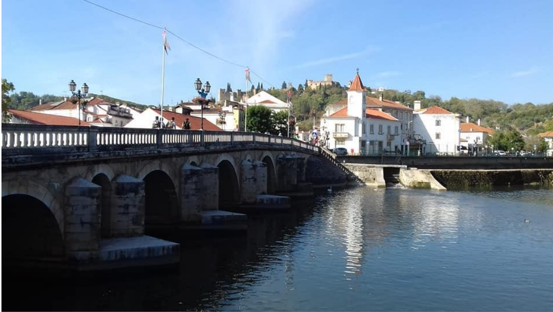
Nabão-joen varrella sijaitseva Tomarin kaupunki tunnetaan muun muassa hyvistä viineistään ja ikivanhasta temppeliherrojen ritarikunnan linnaluostaristaan.