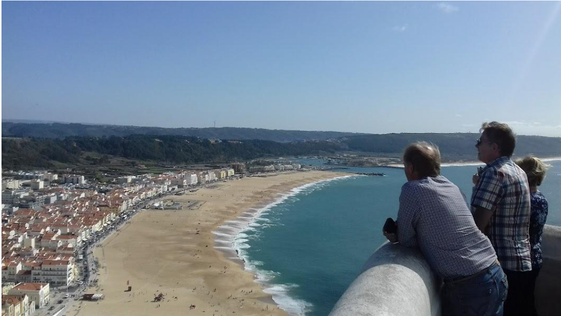
Nazaré on huikeiden näköalojen ja herkullisten kalaruokien paikkakunta Atlantin rannalla.