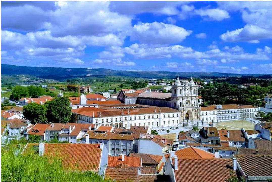
Alcobaça:n kaupunkikuvaa hallitsee valtava luostari.

VASTUULLINEN MATKANJÄRJESTÄJÄ: Useita kymmeniä suomalaisia ryhmiä ja matkatoimistoja vuodesta 2014 lähtien suomeksi palvellut matkatoimisto SUBLU TOUR PORTUGAL ( www.sublutour.com/fi ). Merkin “SUBLU Tour Portugal” takana oleva yritys Maresias e Pradarias, Lda. on rekisteröity Portugalin matkatoimistorekisteriin numerolla RNAVT 7220.