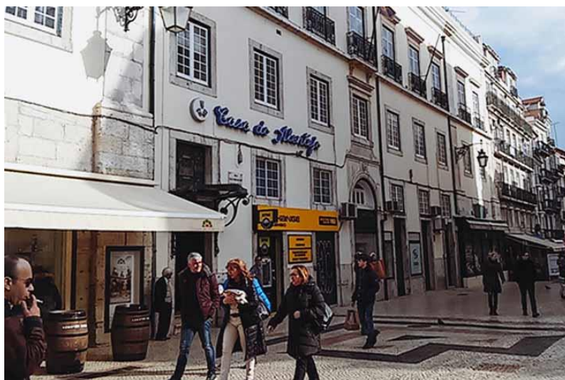
Kuvaamme myös Portugalin pääkaupungin Lissabonin kaduilla.

22.45 Lento saapuu Helsinki-Vantaan lentoasemalle.