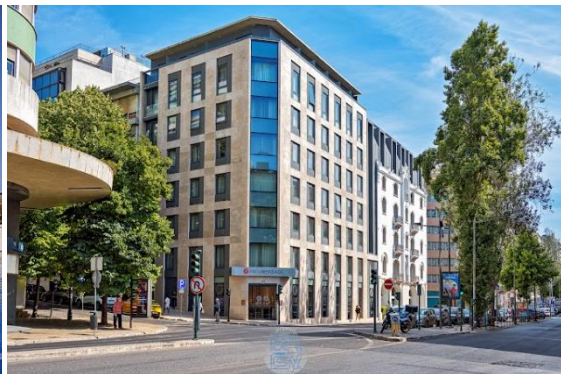
Exe Liberdade Hotel***, Lissabon