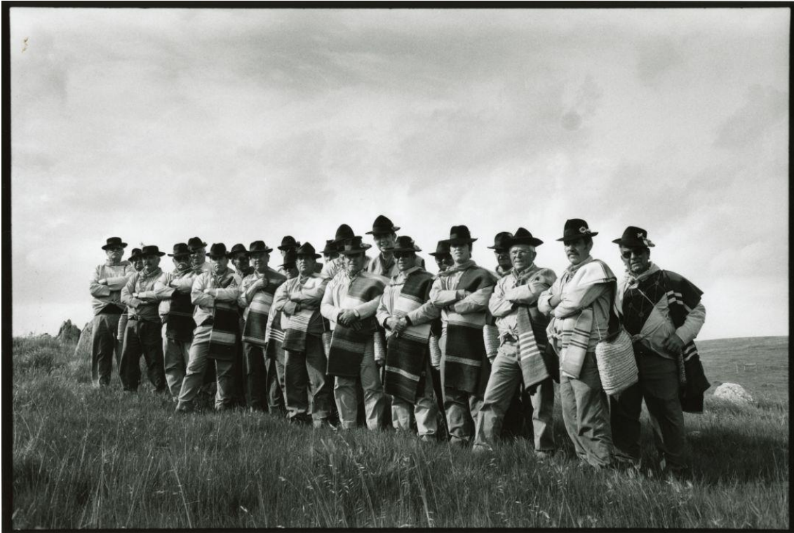
Cante Alentejano -kuorolauluperinne on voimissaan Castro Verdessä.