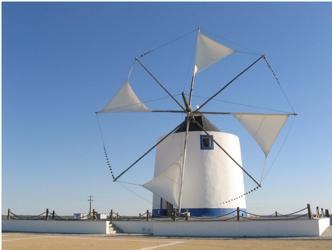
Castro Verden kunnostettu vanha tuulimylly.

- Vastuullinen matkanjärjestäjä: Jo useita kymmeniä suomalaisia ryhmiä, yhdistyksiä ja matkatoimistoja vuodesta 2014 lähtien suomeksi palvellut matkatoimisto SUBLU TOUR PORTUGAL ( www.sublutour.com/fi ). Merkin "SUBLU Tour Portugal" takana oleva yritys Mareasias e Pradarias, Lda. on rekisteröity Portugalin matkatoimistorekisteriin numerolla RNAVT 7220.