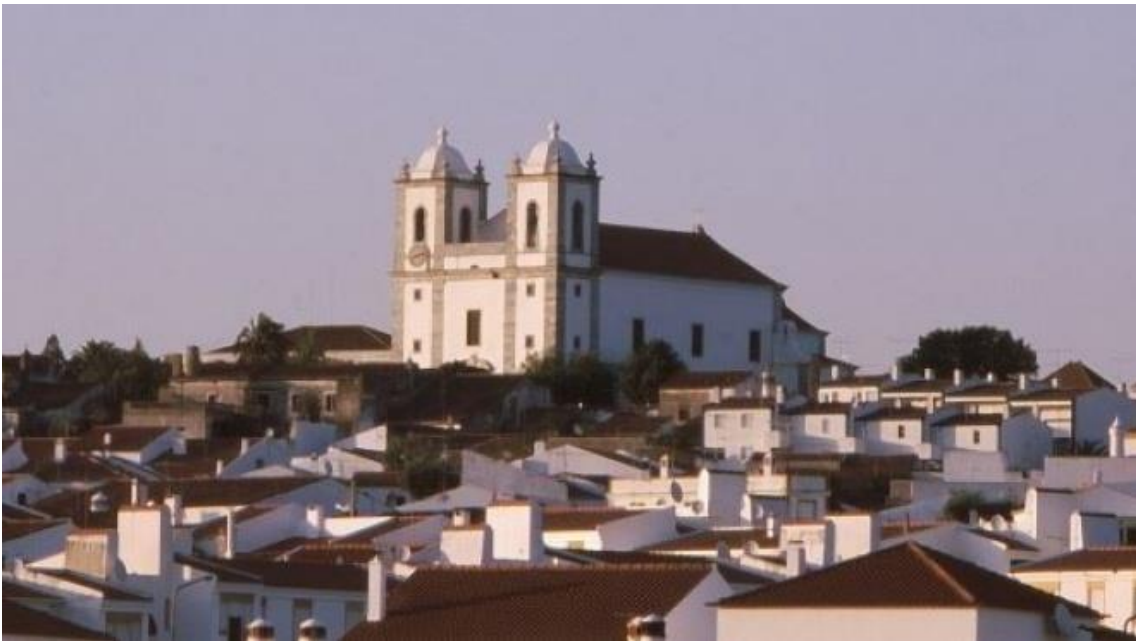
Castro Verde – perinteinen ja aidosti alentejolainen kylä.

Tervetuloa retkeilemään marraskuussa Algarven pohjoisnaapurin, Alentejon maakunnan eteläosassa sijaitseviin Castro Verdeen ja Aljustreliin! Luvassa on tutustumista komeaan paikalliseen musiikkiperinteeseen, Portugalin koululaitoksen historiaan, kunnostettuun vanhaan tuulimyllyyn, muinaisten roomalaisten öljylamppujen kokoelmaan ja ikivanhaan kaivostoimintaan – Alentejon herkkuruokia ja viinejä unohtamatta!