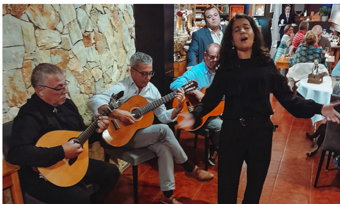
Kaihoiset fadon sävelet soivat meille...