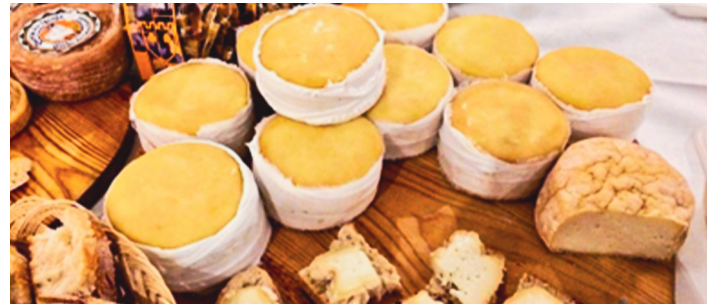
Serra da Estrelan vuoristajuustoa kelpaa maistaa!