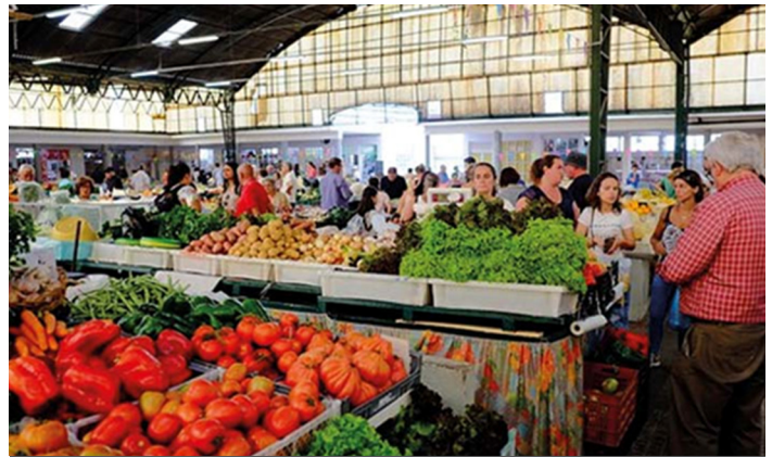
Mercado Municipal – Nazarén perinteinen kauppahalli on yksi vierailukohteistamme.