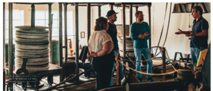
Marvãossa lounastamme vanhassa oliiviöljypuristamossa.