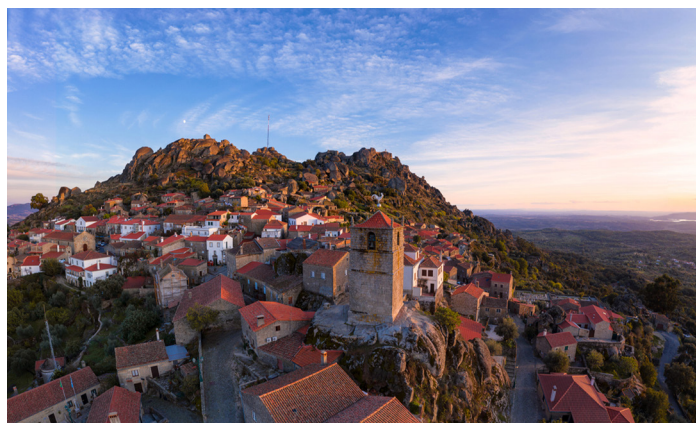
Monsanto – “Portugalin portugalilaisin kylä” – tervetuloa lumoutumaan kivijärkäleiden keskelle!

MATKAN HINTA lentoineen, retkineen, opaspalveluineen, kuljetuksineen, puolihoiton aterioilla viineineen ja hotellimajoituksella jaetussa 2 hengen huoneessa: 1787,00 €/hlö . (Vaihtoehto ilman lentoja, majoituksella jaetussa 2 hengen huoneessa: 1323,00 €/hlö.) Lisämaksu yhden hengen huoneesta: 525,00 €.