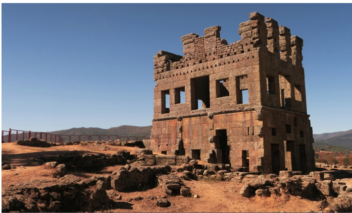
Centum Cellasin mystinen roomalainen torni odottaa meitä Belmonten liepeillä...