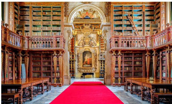
Coimbrassa kuulemme paikallista fadoa ja tutustumme yliopiston kirjastoon.