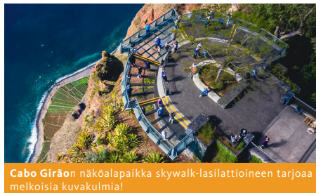
Cabo Girãoon näköalapaikka skywalk-lasilattioineen tarjoaa melkoisia kuvakulmia!