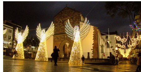
Funchalin katuja koristavat joulukuussa iltaisin kuvaukselliset jouluvalot.

ILMOITTAUTUMISET sähköpostitse matkatoimisto SUBLU Tour Portugalin Mika Palolle ( mika.palo@sublutour.com ) VIIMEISTÄÄN 29.10.2025, kiitos!